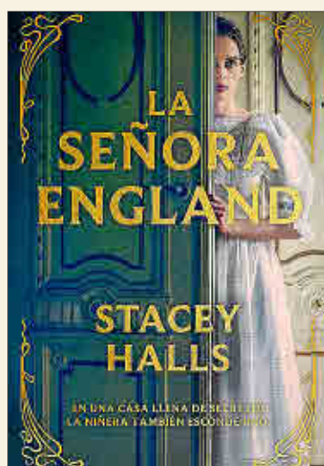
Stacey Halls La señora England UMBRIEL

❖ Adrián Montes y Rhys Cooper tienen un talento innato para la magia, pero no se soportan demasiado. Tras haber tratado de evitarse durante toda su infancia y adolescencia, en sus idílicos veranos en la Toscana, ahora se verán forzados a trabajar juntos para resolver un misterio: el que rodea la muerte de sus madres. Ambas sufrieron un extraño accidente.